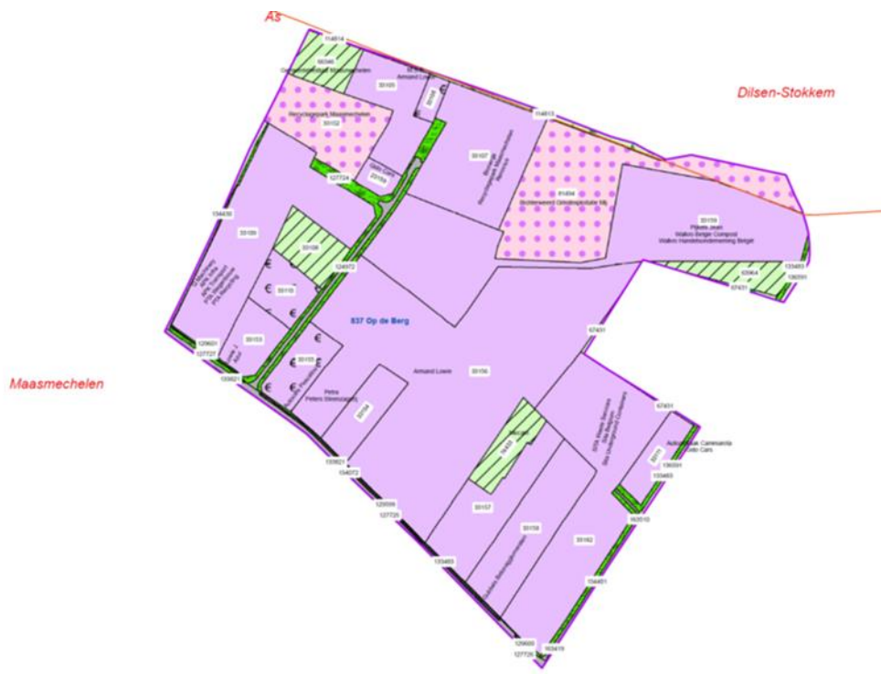
Figuur: Overzicht van de percelering op het industrieterrein

In de omgeving van het industrieterrein wordt de bestemming en het landgebruik grotendeels bepaald door natuur en ontginningen. In 2006 werden, via het GRUP “Berggrindontginning Kempens Plateau”, de ontginningsgebieden uitgebreid. Ter compensatie van de nieuwe grindwinningsgebieden werden de laatste landbouwbestemmingen herbestemd naar natuurgebied. Alle gebieden rond het industrieterrein Op de Berg hebben (na)bestemming natuur.